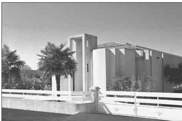
Salle du Royaume, Mauguio.