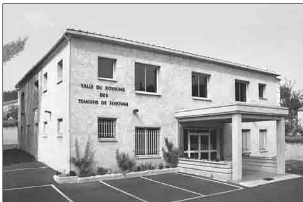
Salle du Royaume, Aubagne.

Pour s'en prémunir, il tente de refuser le permis de construire, ce qui doit être juridiquement motivé (circulaire Delevoeye-Vivien). Souvent, il utilise le droit de préemption en arguant d'un plan d'occupation des sols. Les Témoins ont alors la possibilité de recourir à une juridiction administrative. Cette dernière peut demander à la municipalité de revoir le dossier et de conclure au terme d'un délai fixé. Comme la législation sur les plans d'occupation des sols est précise, les Témoins n'ont pas de difficulté à montrer que le refus du maire n'est pas juridiquement fondé. Les procès se sont multipliés durant ces dernières années.