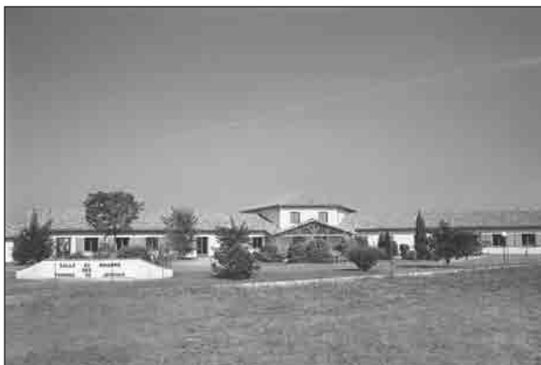
Salle du Royaume, Muret.

du Haut Jura du jeudi 20 août 1987, on peut lire sous la plume de Nicole Thomas : « Samedi et dimanche dernier, le petit village de Houtaud, situé à trois kilomètres de Pontarlier fut envahi par près de 2000 Témoins de Jehovah. Ils s'étaient donné rendez-vous, le temps d'un seul week-end, pour construire une salle de réunion de 300 m 2 ! Les travaux commencés dès sept heures le samedi, étaient terminés le dimanche en début d'après-midi. La première réunion pouvait commencer... ». Nous trouvons le même type de reportage dans le Dauphiné Libéré du 27 novembre 2000 (qui souligne que le bâtiment en forme de chalet s'intègre bien au paysage) et dans le Journal de Saône-et-Loire du 15 juin 1992. Au total, un peu plus de 80 salles du Royaume auraient été construites en un week-end.