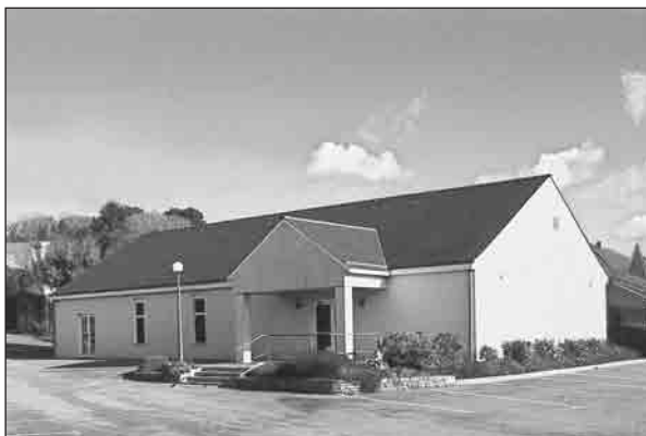
Salle du Royaume, Quimper.