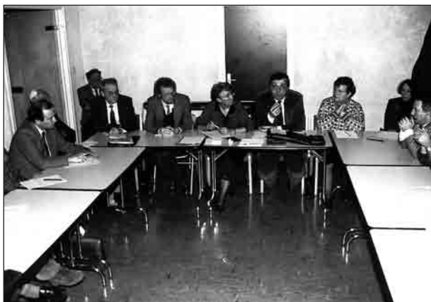
Une réunion du conseil d'administration de la Renaissance du Vieux Lyon.

L'UCIL revendique avec d'autres partenaires, à partir de 1989, une maison de l'environnement : « Les animateurs de ce projet qui ont formé une association loi 1901, considèrent à juste titre que l'environnement de l'homme du XXI e siècle finissant est à la fois naturel et urbain et que l'on ne peut dissocier ces deux visions qui doivent rester complémentaires » 38 . Cette revendication