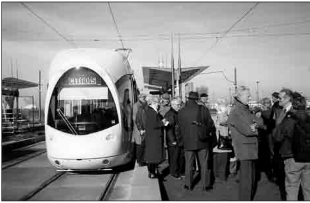
L'association Lyon-Métro au cours d'un essai du nouveau tramway avant la mise en service.

toriale sud 9 . Pour se distinguer du CIL des Pentès de la Croix-Rousse, il porte dans son nom une référence topographique, « tout ce qui était plat dans le premier arrondissement, c'était chez nous » 10 . Ainsi, à cette appellation nouvelle – Centre Presqu'île – correspond un territoire découpé artificiellement par soustraction des zones d'influence des comités précédents. Il s'agit d'un secteur globalement homogène (en terme d'activités commerciales mais peut-être aussi sociologiquement) par rapport aux pentes de la Croix-Rousse (alors en voie de paupérisation) 11 et au quartier « de derrière les voûtes », comprenant le secteur des Terreaux (Mairie Centrale), la place Bellecour (lieu symbolique lyonnais) et le quartier d'Ainay (ancien bastion de la « bourgeoisie » lyonnaise). Le CPI se mobilise sur le terrain très parcellaire et consensuel de la valorisation à apporter au domaine public 12 dont les principes sont énoncés dans la charte des centres anciens. Cette politique de sauvegarde du centre ancien s'appuie sur les structures associatives locales 13 et amène les élus à créer une structure de réflexion ad hoc de la communauté urbaine sur un périmètre plus restreint. Cette stratégie offre au CIL-CPI la possibilité d'avoir accès aux éléments de réflexion d'ensemble, l'urbanisme étant de compétence communautaire.