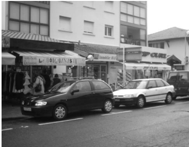
La présence physique et symbolique du surf dans le centre-ville d'Hossegor