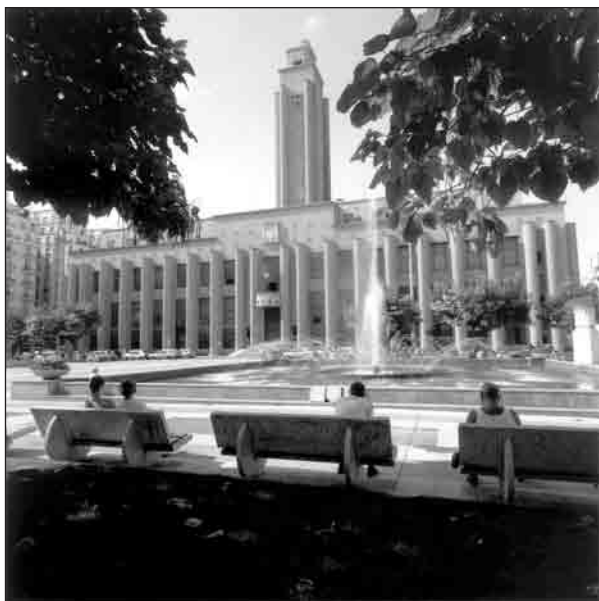
Place des Gratte-ciel, l'hôtel de ville.

Les composantes de ce dispositif, excepté le groupe ressource, sont ouvertes à l'ensemble des destinataires du projet 15 . Les destinataires appelés à rejoindre le groupe ressource sont des représentants d'associations d'habitants, d'usagers et d'exploitants, de conseils de quartier et des institutions publiques telles que la Police ou la Poste. La composition du groupe a fait l'objet de discussions entre les élus et les techniciens, les élus ayant le dernier mot. Les membres sont (re) connus par les autorités publiques et connaissent les rouages des institutions – entre autres connaissances, les bonnes manières à respecter 16 dans les échanges publics. Plus largement, le groupe ressource s'insère dans les réseaux professionnels ou politiques des acteurs mobilisés dans l'expérience de concertation. Ainsi, la quasi-totalité du groupe se connaît préalablement à sa constitution et entretient des relations plus ou moins régulières.