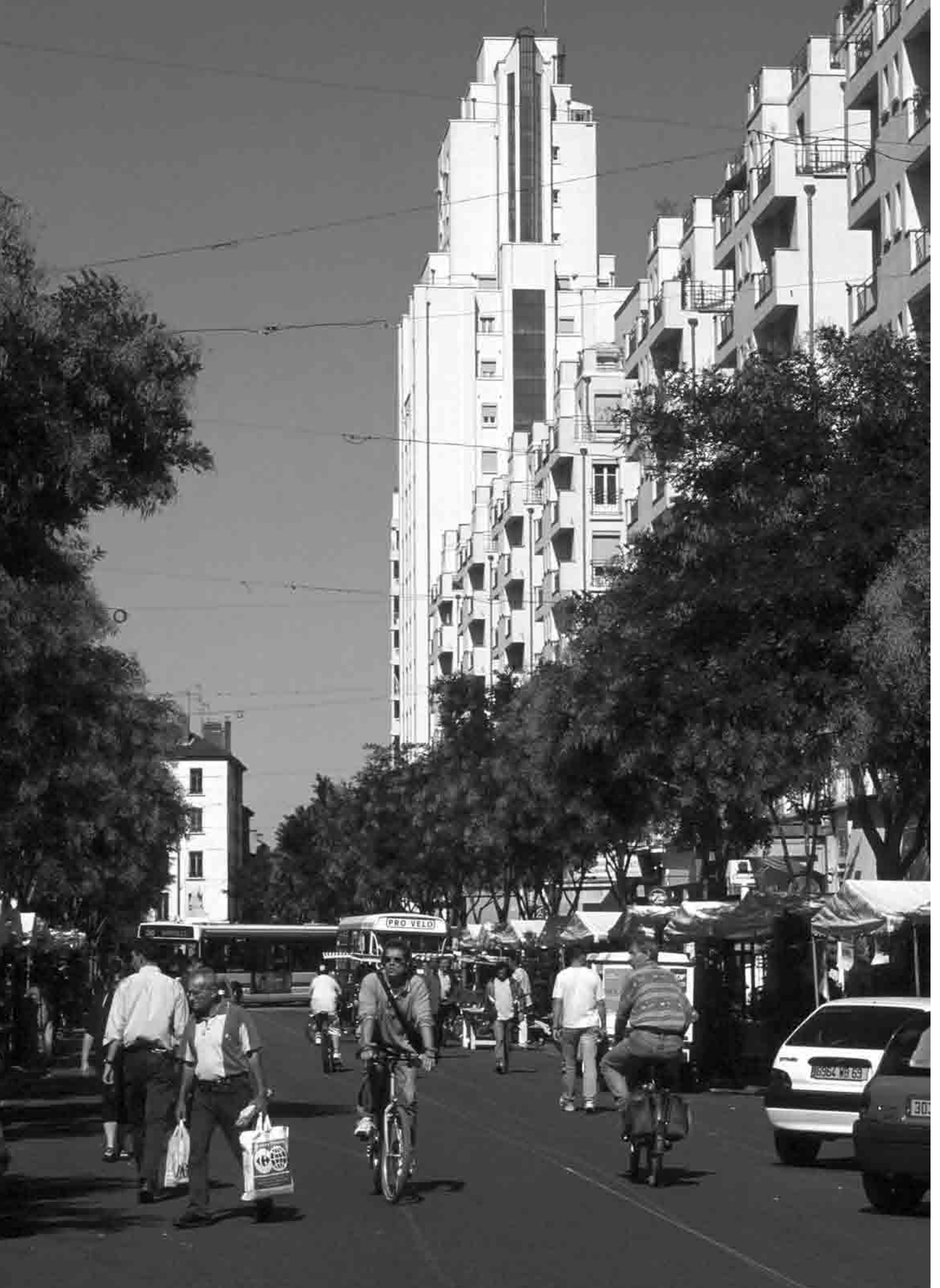
Place des gratte-ciel à Villeurbanne lors de la journée sans auto.