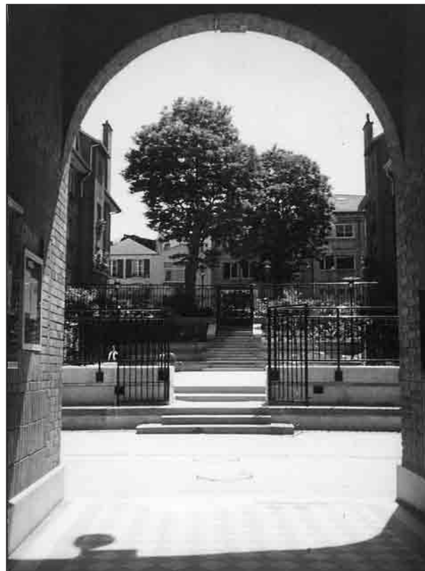
Cloisonner les passages traversants.

La même logique qui commande la relégation de l'espace public commande aussi la gestion des usages : il s'agit de « neutraliser les lieux qui peuvent servir de points de rassemblement ou de regroupement pour les