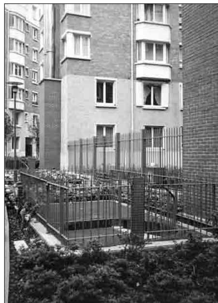
Définir des entités fonctionnelles.

Un glissement de sens va donc s'opérer de façon progressive dans le langage de la requalification urbaine. Au départ, on parlait de « recoudre » les grands