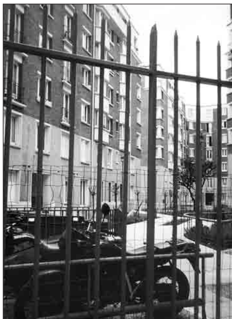
Sécuriser les pieds d'immeubles.

Pour répondre à cette question, il faudrait peut-être commencer par définir la logique sous-jacente qui détermine « l'évidence » de ces solutions en les présentant comme des réponses « inévitables » à des situations de terrain qui s'imposent dans les mêmes termes à tous les acteurs. Cela conduit à questionner la nature de la demande sécuritaire qui se trouve à l'origine de la démarche adoptée dans les opérations que nous avons