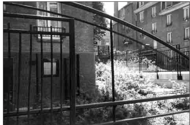
Sectoriser les espaces.

dans le tissu parisien traditionnel. Pour résoudre les problèmes de dysfonctionnement qu'ils connaissent, il faut les «banaliser» et en faire «des quartiers comme les autres». Cette démarche, qui constitue le point de départ de la plupart des opérations de requalification urbaine entreprises sur les grands ensembles parisiens depuis quelques années, n'est évidemment pas nouvelle en soi. Depuis les années 1970, la critique de l'urbanisme moderne est devenue le leitmotiv de toutes les interventions urbaines dans les sites «à problèmes».