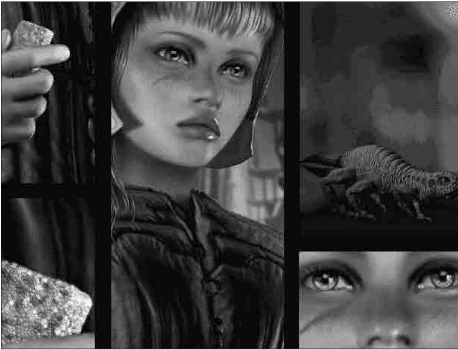
Synkha la cyborg.

suivre. Il n'est bien sûr pas souhaitable d'en rester durablement à ce stade. Par rapport aux concepts, les métaphores présentent toutefois l'avantage de s'accommoder assez facilement des contradictions, de les rendre plus faciles à appréhender, en attendant que s'élaborent des grilles d'analyse permettant de les expliquer.