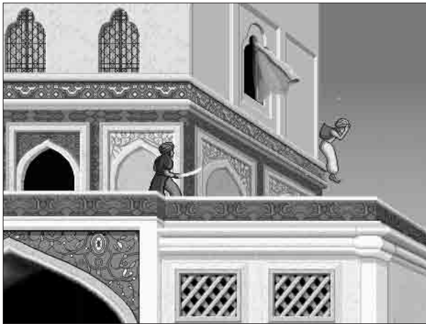
Rixes au palais.

A ce stade on serait tenté de comparer le pouvoir des jeux électroniques à celui du cinéma. Un certain cinéma commercial se rapproche il est vrai de leur univers au point de s'en inspirer parfois 9 . Mais la comparaison achoppe sitôt que l'on s'aventure du côté du film d'auteur ou même de celui qui tente de raconter une histoire originale. Car le propre des jeux électroniques est d'avoir recours à des stéréotypes tellement familiers que leur contenu narratif se trouve en quelque sorte neutralisé au profit de l'effet de reconnaissance. D'où l'étrange impression de répétition