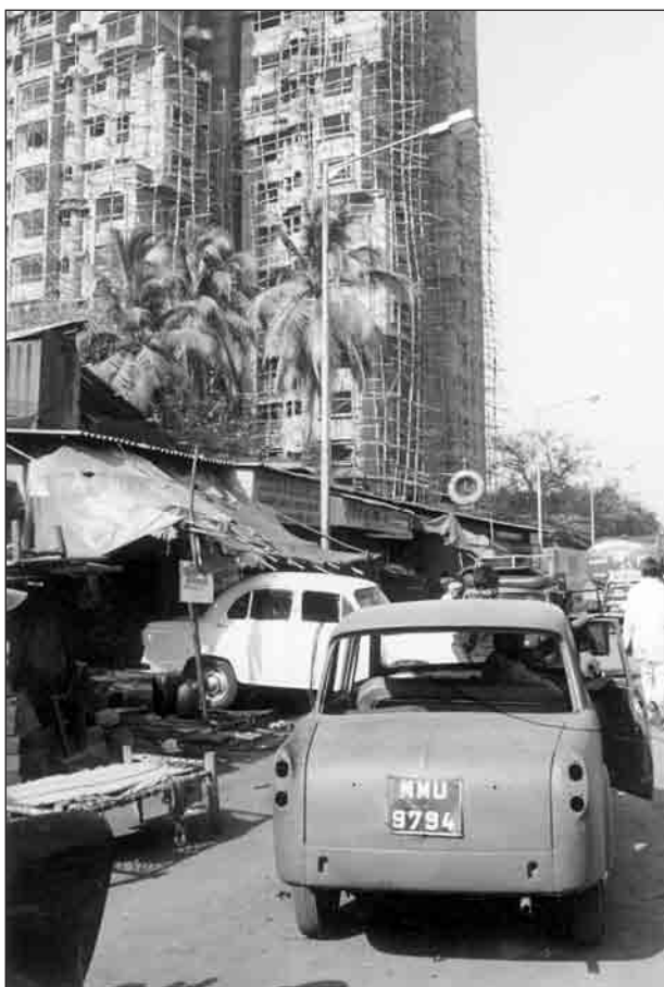
Tour en construction (1994) à Parel.

La communautarisation de l'espace bâti n'a pas régressé, bien au contraire, dans les quartiers populaires du centre ville. Elle a cependant changé de