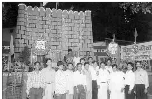
Branche n° 42 de la Shiv Sena à Kalachowki.

La Shiv Sena infléchit fortement les modes populaires d'appropriation globale de la ville nés avec les fêtes religieuses au XIXe siècle, puis les grèves, le mouvement national et le mouvement pour la création du Maharashtra (1950-1960). Elle incita systématiquement ses membres, notamment les jeunes ouvriers et chômeurs, à manifester vers les beaux quartiers et à s'approprier les promenades de bord de mer et la plage, auparavant réservés aux riches. Le parti a longtemps (1976-1985) eu tendance à favoriser le statu quo dans le secteur du logement, où le surpeuplement et le mauvais état du bâti étaient échangés contre une sécurité relative et des loyers très bas ou inexistantes. Elle entreprit pourtant de changer aussi les modes quotidiens d'habiter le quartier, d'abord en s'attaquant à l'omniprésence de l'ordure, puis en forçant les administrations à faire leur travail