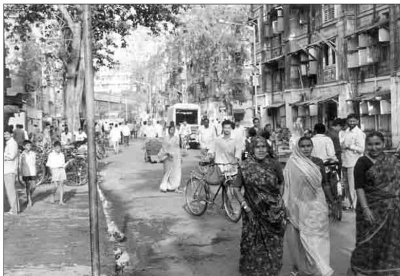
Rue de chawls à Currey Road.

L'appropriation de la rue était d'abord le fait des usiniers, de leurs sirènes et de leurs charrettes mais les normes qui avaient prévalu dans la « ville noire » avaient aussi cours, au moins partiellement dans les