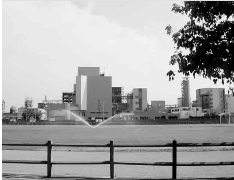
DR Le terrain de foot du stade de Pierre-Bénite et les ateliers de l'usine Atofina.

porté sur les liens établis de longue date entre les habitants et l'entreprise, l'histoire de l'immigration ouvrière étant mise en avant : « Les Pierre-Bénitains ont presque tous un père, un oncle, ou un cousin d'Ato ». Ceci signale la nécessité pour les élus d'expliquer le sens de la présence industrielle chimique sur le territoire communal.