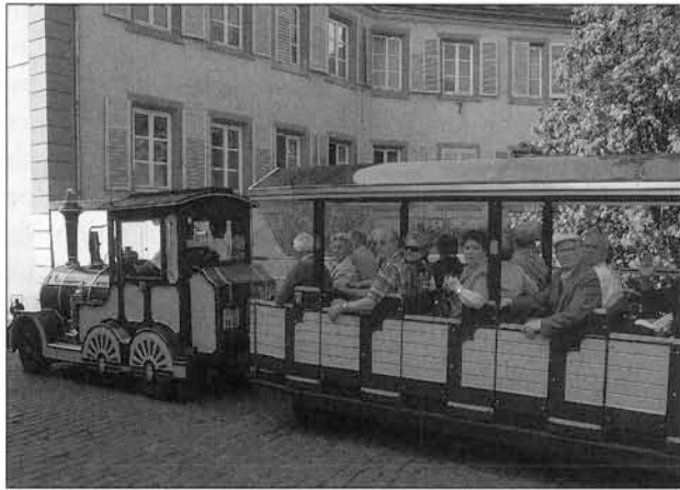
Train touristique à Colmar

à faire éclore de nouveaux repères et patrimoines, de l'échelle globale à l'échelle locale, s'attachant qui à un édifice, qui à un jardin, une plante sauvage ou cultivée. Ces cercles d'initiés, professionnels et amateurs confondus, émaillent les territoires de références et de ressources identitaires, qui ne sont pourtant pas accessibles à un large public (Dubost, 1994). Chacun réinvente son patrimoine. La patrimonialisation gagne des objets aussi hétéroclites que des anciens chemins, des fleuves, des cultures gastronomiques ou des pratiques corporelles. Les contours du patrimoine sont de moins en moins circonscrits et s'étendent sur des territoires entiers.