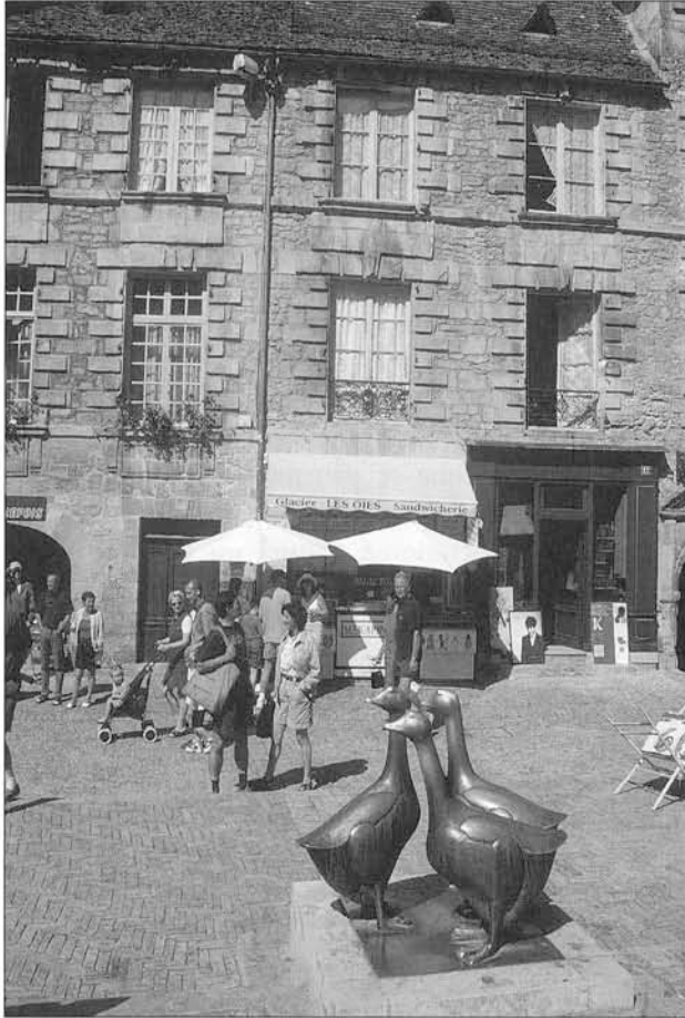
Patrimoine et domestication

concurrence le patrimoine naturel. La dissociation entre la mémoire vivante et le savoir édifier que Françoise Choay met en évidence à propos de l'architecture gagne par les biotechnologies l'édifice du vivant. L'information est-elle pour autant libérée de sa gangue matérielle ?