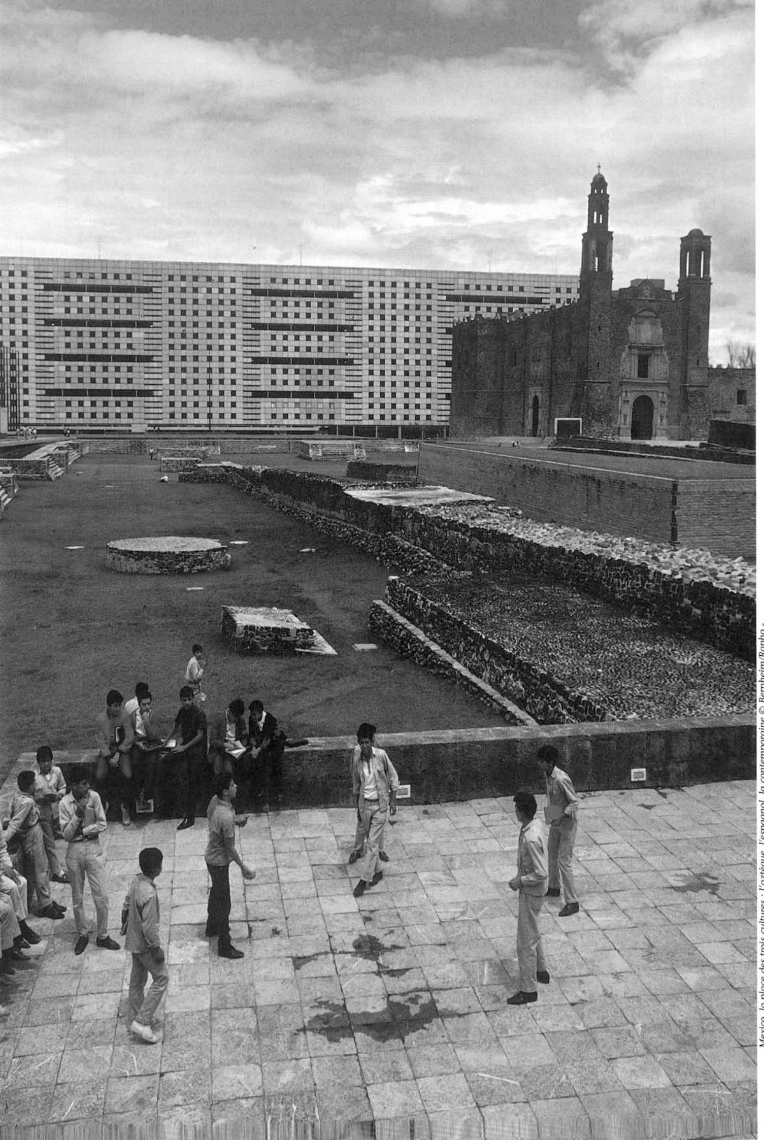
Mexico, la place des trois cultures : l'aztèque, l'espagnol, la contemporaine © Bernheim/Rapho -