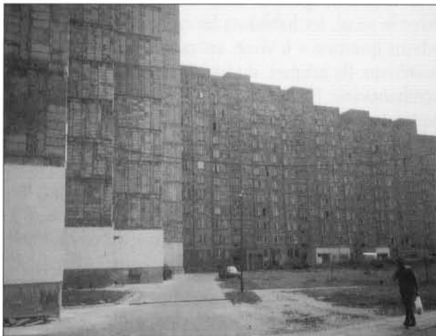
Le grand ensemble de Brodno a déjà plus de 20 ans d'existence

D'un point de vue purement « technique », ce sont finalement les réalisations du réalisme socialiste qui résistent le mieux aux assauts du temps. Et quand la population dénonce les conditions de logements subies pendant le socialisme réel, elle montre en fait du doigt les grands ensembles plus récents. La question de la durabilité du patrimoine urbain est donc tout à fait actuelle, puisque la grande majorité des grands ensembles ont aujourd'hui une trentaine d'années.