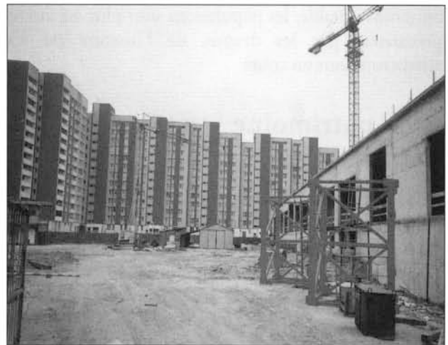
Brodno est le grand ensemble le plus déconsidéré de la capitale.

La précipitation d'une construction de masse censée combler un déficit devenu structurel finit par imposer le gigantisme des formes, la piètre qualité paysagère et technique, l'uniforme médiocrité des conditions de logement dans les barres de préfabriqués. La taille moyenne des logements coopératifs en milieu urbain est de 50 m 2 . Ainsi, la structure coopérative conçue pour donner lieu à une relation d'appropriation collective de l'habitat à l'échelle de ces ensembles d'habitation (ce qui était le cas dans l'entre-deux-guerres) fut « dénaturée » par la montée en puissance des coopératives devenues de vastes conglomérats, auxiliaires serviles du pouvoir car presque entièrement financées par lui. Ce lien social particulier entre l'espace privé du logement et l'immeuble, cette relation de territorialisation à l'échelle du milieu de vie, existe là où le peuplement a conduit à une certaine homogénéité sociale de populations hautement diplômées. Alors, la dynamique sociale fonctionne dans le cadre des coopératives et contribue à l'amélioration des conditions de vie sur l'ensemble de la cité concernée (exemple d'Ursynow-Natolin à Varsovie). À l'inverse, dans les grands ensembles ouvriers proches des usines, le repli des habitants sur la cellule d'habitation est net, les coopératives ne sont que des administrations inefficaces car désinvesties, et le bâti, les espaces publics y sont particulièrement dégradés. Le regard social perçoit nettement ces nuances