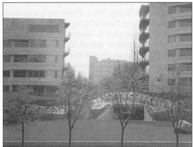
Holland Park est le type même de construction résidentielle de luxe implantée en centre ville

depuis 1990 mais ceci ne constitue que l'aggravation d'un marasme dans la construction qui débuta dès la fin des années 1970 et culmina pendant les années 1980. Le parc de logements urbains n'a crû que de 9% entre 1990 et 2000 (+ 650 000 logements), alors que la pénurie à la fin du régime socialiste était estimée à 2 millions de logements pour tout le pays. Le système de financement de la construction coopérative fut profondément déstabilisé, sans qu'un secteur alternatif de la construction n'ait eu la possibilité de se mettre en place. L'industrie du bâtiment a perdu sa clientèle, et le déficit de main d'œuvre et de formations dans ce secteur ne s'est pas encore résorbé. En faillite, en cours d'éclatement, transformées en « développeurs » ou réduites à l'état de co-propriétés de gestion, les coopératives assurent encore malgré tout la majorité de la construction résidentielle urbaine, alors qu'ailleurs elles sont concurrencées par les promoteurs et les constructeurs privés. Les entreprises ne construisent plus de logements, et la construction communale commence tout juste à renaître. Prioritairement chargées de soutenir les organismes de logements sociaux créés en 1995, les communes leur facilitent l'accès au foncier.