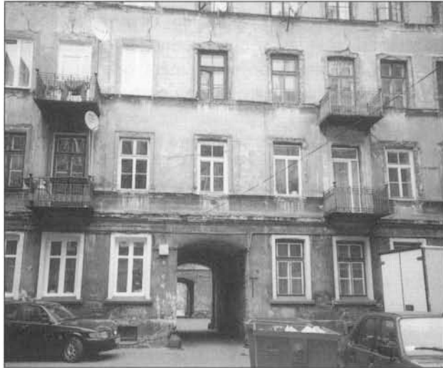
L'habitat « caserne » du faubourg industriel de Praga est dense

Les quartiers anciens historiques ont été dans quelques cas reconstruits à l'identique après leur destruction totale par les nazis ou pendant l'insurrection de Varsovie. Cette reconstruction scrupuleuse, à haute valeur patriotique (« Toute la nation reconstruit la capitale ») à Varsovie fut répétée à Gdansk, Poznan, Wroclaw, Opole.. Jusqu'aux années 1990, ces quartiers n'étaient pas radicalement « gentryfiés », sauf dans les plus grandes villes, et une certaine mixité sociale et fonctionnelle y résistait. Mais beaucoup plus nombreux sont les immeubles anciens situés dans des quartiers « banals » du XIX ème ou du