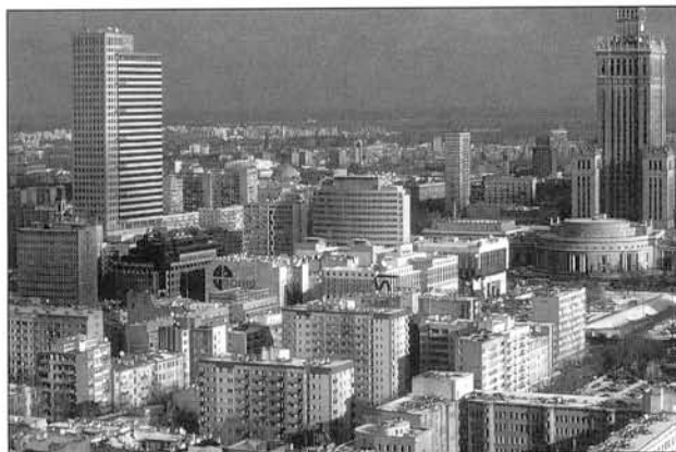
Le centre ville de Varsovie

Considérées sur le long terme, les villes polonaises sont vulnérables. Le réseau urbain est marqué par un faible degré de concentration, qu'on peut expliquer notamment par la fragilité de l'Etat polonais. Au cœur de la « zone de broyage » des empires d'Europe orientale, celui-ci a connu d'incessants changements de