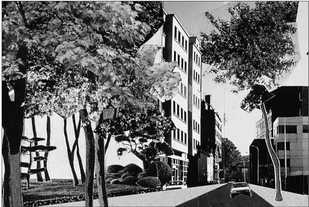
Lyon Confluence, projet, photomontage. Ce parc urbain se déploie dans l'épaisseur de la ville grâce à une résille arborescente.

La péninsule de Greenwich – vaste quartier industriel du Londres du XIX e siècle – s'ouvre à l'urbanité avec les festivités de l'an 2000. Dans la grande tradition des expositions universelles, un fragment de ville de 2 km de long sur 700 m de large, accueille un aménagement provisoire pour l'ouverture de l'exposition du millenium . Quand les aires de parking, les bâtiments d'expositions et autres structures d'exposition sont des vocations provisoires, il en va tout autrement pour le schéma de voiries et les « espaces verts » qui sont chargés de préfigurer un futur quartier de ville. Or, esquisser une ligne d'horizon en terme d'économies et de pratiques urbaines sur ce site pour les vingt ans à venir, est aujourd'hui pour le moins risqué alors que cela n'effrayait pas les urbanistes des décennies passées.