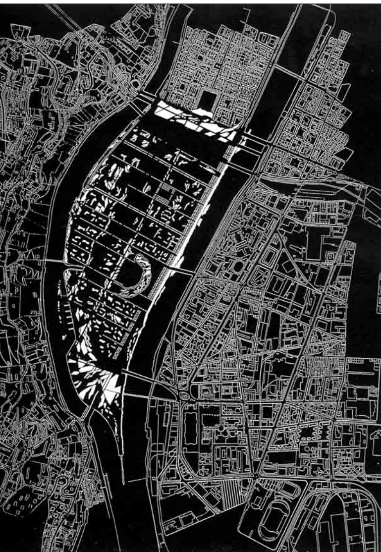
Lyon : parc urbain, presqu'île sud de Lyon, projet C. Mosbach.

les aires engazonnées et canalisent les promeneurs sur les sentiers, ici les vastes étendues s'ouvrent aux libres appropriations récréatives. L'absence de clôture, distinction majeure entre ce parc parisien des années quatre-vingt 5 et ceux d'aujourd'hui ou d'après guerre, change le statut de son sol. C'est ici que des milliers de personnes se croisent lors d'un déjeuner sur l'herbe, que des équipes inédites improvisent une partie de football, que le cinéma projette ses images sur une toile géante en fond de nuits étoilées et de ville épannelée.