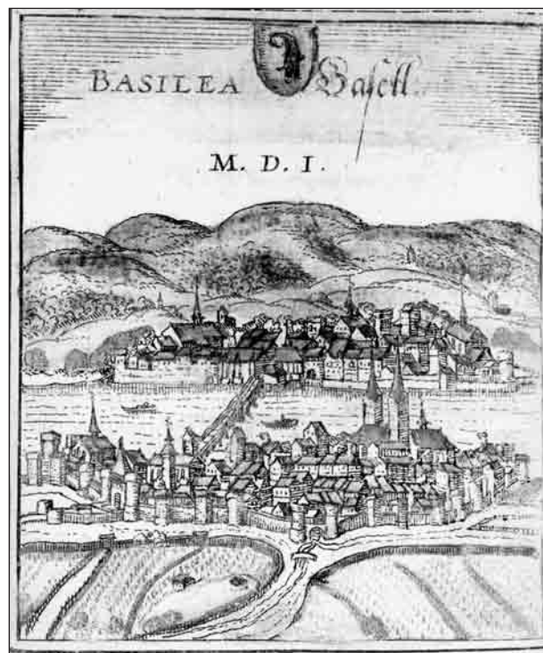
Bâle : manuscrit allemand, « Toutes les villes du monde », Bauer et Hogenbergius, Cologne, vers 1550.

À Bâle, l'usage du tramway a survécu à l'ère hégémonique de l'automobile. Les équipes municipales se sont données les moyens d'une mixité de modes de