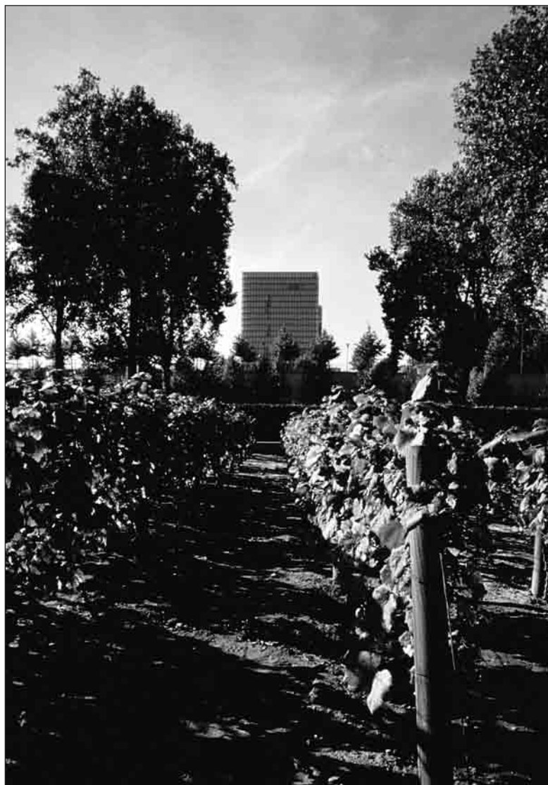
Le Parc de Bercy à Paris.

Les premières sections ont montré le risque d'un traitement différentiel entre les « façades tramway » anoblies par l'arrivée du mode de transport et les « façades arrières » abandonnées à leurs évolutions. Un autre risque est le bouleversement provoqué par une station favorisant le développement de telle fonction au détriment de telle autre, les bureaux et commerces au détriment des logements par exemple. Sous cet angle la ligne produit une nouvelle discrimination spatiale, non plus dans une logique concentrique centre/périphérie, mais dans une logique axiale devant/derrière. Le principe de lignes actives ne résout donc pas la question de la profondeur qui doit être relayée par d'autres économies et d'autres formes de paysages. La solution tramway se révèle aujourd'hui un prétexte de paysage pour la décongestion centre/périphérie des villes françaises, son traitement dans les nouveaux quartiers à créer reste à