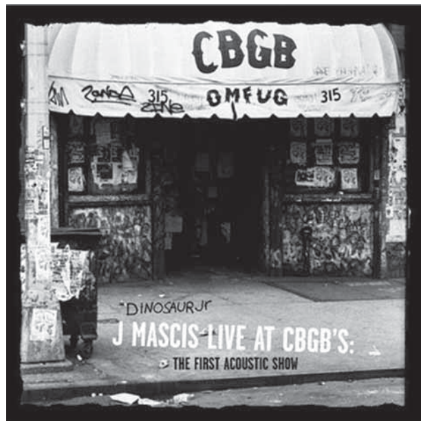
Pochette de CD, « Dinosaur Jr », Warner Music Ltd, 2006

Dans cette logique, les travaux qui mobilisent la notion d'ambiance s'attachent en fait plus à décrire et qualifier des ambiances qu'à mettre en place des schémas d'explication et de causalité. Ce qui en soi n'est pas un problème. Toutefois, il faut expliciter comment et quelle classe de phénomènes sont décrits autour de cette notion. En ce sens, on peut s'interroger sur la prééminence, dans les recherches autour de la notion d'ambiance, des méthodes et outils utilisés. Si en effet la notion d'ambiance n'est pas saisie comme le résultat de processus sociaux et historiques qui ont fait tels ou tels lieux ou mécanismes de perception, c'est que l'ambiance n'est finalement que ce que mesurent les outils. Plus précisément, on peut se demander si l'usage de cette notion n'est pas pris au piège de ce que l'on nomme parfois « l'opérationnalisme », et qui est le piège commun des travaux qui refusent de définir leurs concepts. C'est-à-dire cette tendance qui fréquemment dans le monde scientifique fait confondre le débat sur les outils de mesure avec le débat intellectuel et scientifique sur les notions elles-mêmes, sur leur définition. C'est ainsi qu'on finit par laisser penser que « l'intelligence c'est ce