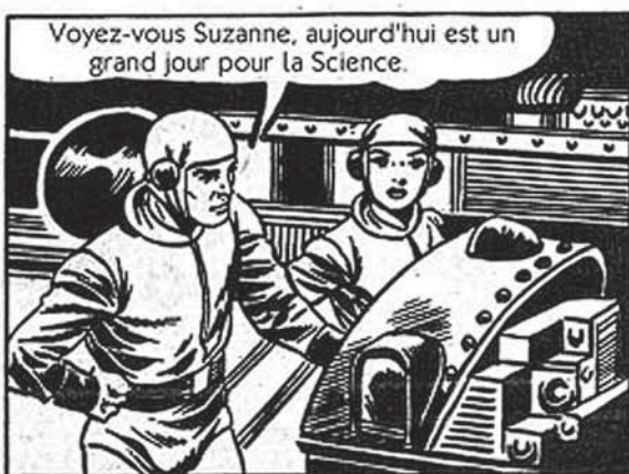
« Wroom Tchac Zowie », Robert Benayoun, 1968

Ambiance. Ce terme au demeurant mal découpé du langage commun paraît aujourd'hui emporter un franc succès, en particulier dans le monde de la recherche architecturale et urbaine qui, à cheval entre savoir et action, semble avoir trouvé dans cette notion une importante ressource comme l'illustre entre autres choses le récent numéro du bulletin Culture et recherche édité par le ministère de la Culture