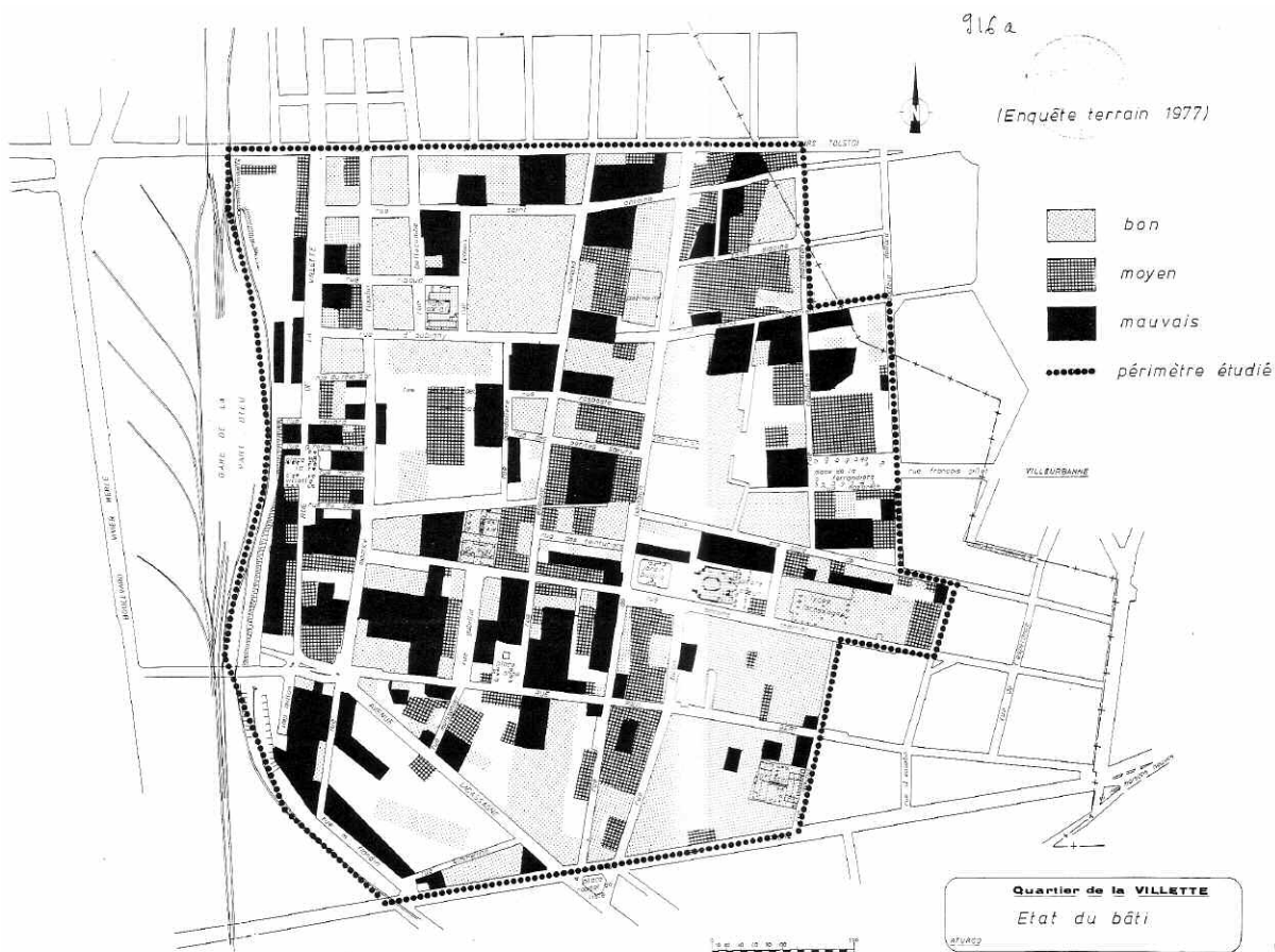
Lyon, quartier de la Vilette, état du bâti analysé par l'agence d'urbanisme en 1977

aussi précisément les creusets d'une approche pluridisciplinaire 7 des questions d'urbanisme et de planification alors que dominaient les démarches pilotées par des architectes-urbanistes, incarnant la figure de « l'homme de l'art » de l'urbanisme façonnée durant l'entre-deux-guerres. Par le caractère pluridisciplinaire des équipes mises en place localement, ont-elles cherché – et de quelles manières ? – à abolir la distinction entre savoirs experts et savoirs savants précédemment cités ? Les communications de Fatiha Belmessous 8 et Gilles Bentayou 9 ont mis en évidence que le champ des grands ensembles à la fin des années 1970 (à travers les dispositifs HVS puis DSQ/DSU), contemporain de la création des OPAH en quartiers anciens et de la redéfinition des études préparatoires aux opérations d'aménagement par la circulaire du 3 mars 1977, a été l'occasion pour l'agence d'urbanisme de Lyon d'apporter une connaissance qualitative, sociologique, éloignée des métiers « traditionnels » de la rédaction des documents d'urbanisme. La comparaison menée par Gilles Bentayou entre les études produites par l'Atelier d'urbanisme de Charles Delfante entre 1961 et 1977 et les études préalables et plans de référence réalisés par l'agence au début des années quatre-vingt est riche d'enseignement mêlant étroitement la forme et le fond. D'un côté, des rapports finaux n'excédant pas une