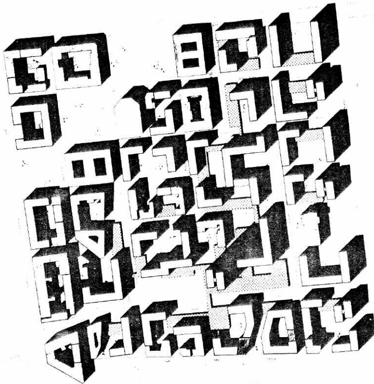
Plan masse de l'îlot Servient-Rancy, dans le quartier des Brotteaux à Lyon (Charles Delfante, architecte)

questions posées par les élus et davantage d'interroger les questions elles mêmes) la culture dominante des agences reste celle du départ : postuler que la ville doit s'efforcer d'être mieux que celle déjà faite 21 , d'où s'ensuivraient des postures de conviction pouvant masquer des a priori strictement idéologiques d'origines multiples. « Cette tendance se traduit par une prédisposition à édicter la « norme », quitte à suivre « la mode » » écrit Rémi Dormois. Le lien établi et entretenu avec la recherche permettrait selon lui d'agir comme un « antidote » qui « désenchanterait » une réalité que la pratique urbanistique tend toujours à vouloir « enchanter ». Elle opposerait à la poursuite de « l'idéalité » un principe de « réalité » qui tendrait à l'équilibrer sans toutefois le détruire.