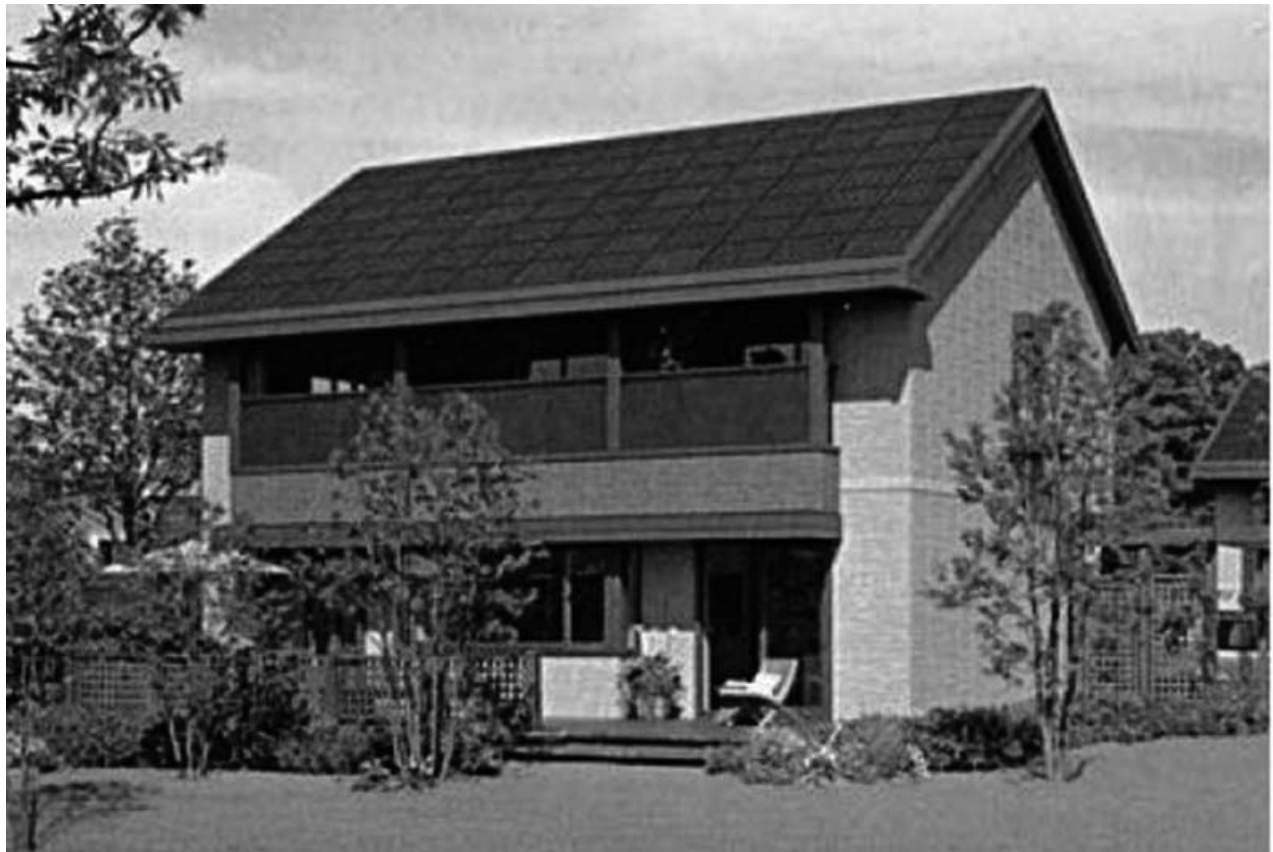
Maison solaire «Misawa Homes Z»

Dans la conception « économie et production d'énergie », l'objectif prioritaire n'est pas la forte baisse de la consommation, mais une certaine économie d'énergie articulée à une production d'énergie le plus souvent d'origine solaire, notamment par système photovoltaïque. Ce modèle correspond souvent à des politiques de pays qui visent à éviter des pics de consommation d'électricité de réseaux surchargés. Trois variantes peuvent être distinguées :